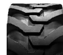
CAMSO SL R4